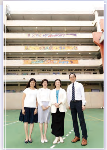
校長與三位副校長合照