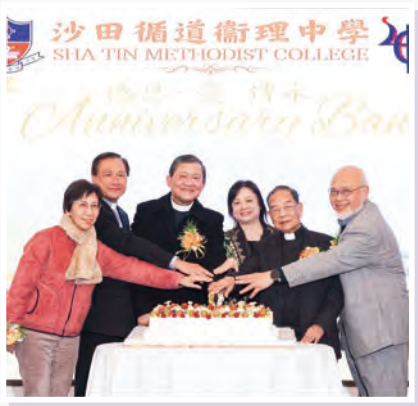
校長與嘉賓主持切餅儀式

樊老師亦很感恩有一眾學生領袖努力付出，體現僕人領袖的精神。希望他們透過晚宴，能夠感受到舊生與老師、學校之間寶貴的情誼，畢業後亦能將這份愛傳承下去。她感恩有上帝的眷佑，晚宴才得以順利舉行。願這次晚宴的喜樂成為「沙循人」的珍貴回憶，並期望下次再聚。