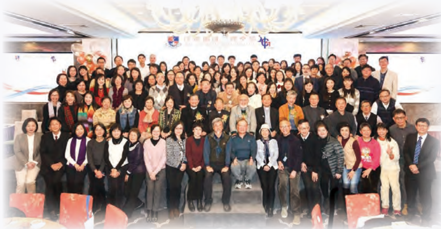
四十周年晚宴大合照，新舊老師與嘉賓聚首一堂。