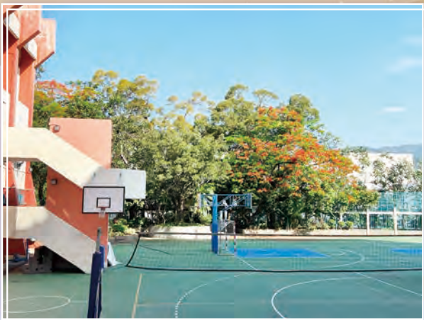
校園一角的影樹紅