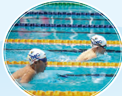
水運會上泳手奮力作戰，力爭佳績！