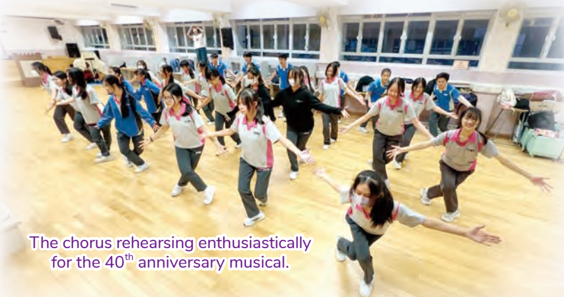
The chorus rehearsing enthusiastically for the 40 th anniversary musical.