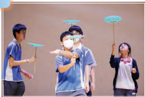
中二同學在全方位學習日上展示學習成果