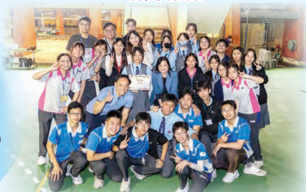
公益少年團為區內無家者和長者籌辦燒烤活動，意義非凡！