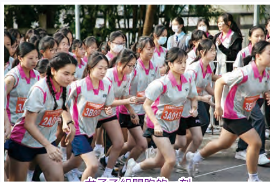
女子乙組開跑的一刻