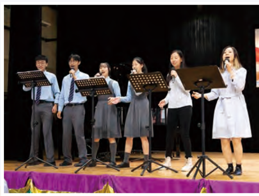
由學生和校友組成的敬拜隊在 感恩崇拜中歌頌上帝