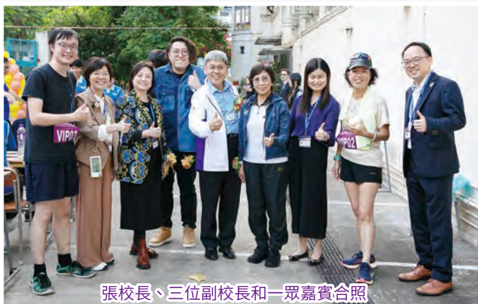
張校長、三位副校長和一眾嘉賓合照