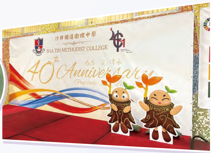
40周年大型海報及「小循」吉祥物均由校友設計