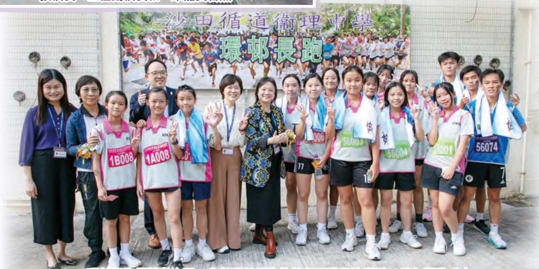
環村長跑得獎者合照，參與環村長跑的健兒更獲學校贈送40周年運動毛巾。