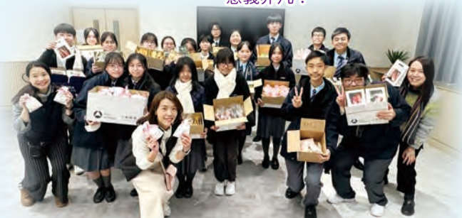
同學在售賣公平貿易產品的活動中，宣揚公平貿易的概念。