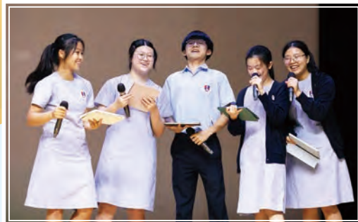
中五同學在全方位學習日上展示學習成果