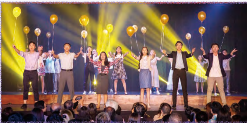
The final scene of the 35 th anniversary musical, Thus Saith the Moon.