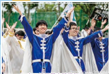
中五級同學齊跳級舞，享受中學生涯最後一次的水運會。