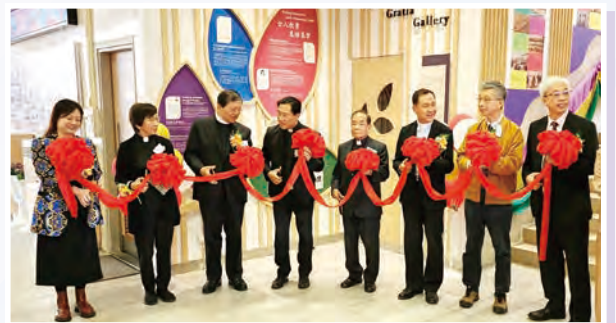
各嘉賓主持校史廊剪綵儀式