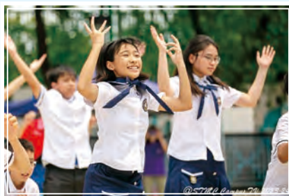
同學為水運會運動健兒打氣