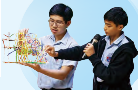
中四同學向同學講解自製飲管模型的原理