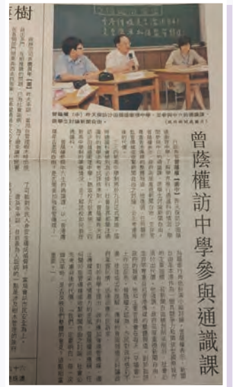
時任特首曾蔭權先生來訪本校的剪報