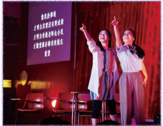
Two of the main cast members of the 35 th anniversary musical, respectively playing the role of a teacher desperate to help the student overcome challenges and a student who is eager to become a successful actor.

The journey toward staging the musical is ongoing, with both teachers and students steadfastly toiling to prepare for the much anticipated early October performance in the school hall. As anticipation mounts, let us eagerly await the unveiling of this magnificent musical, a musical that is fruition and a celebration of their hard work.