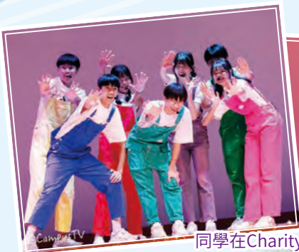
同學在Charity Show舞台上傾力演出