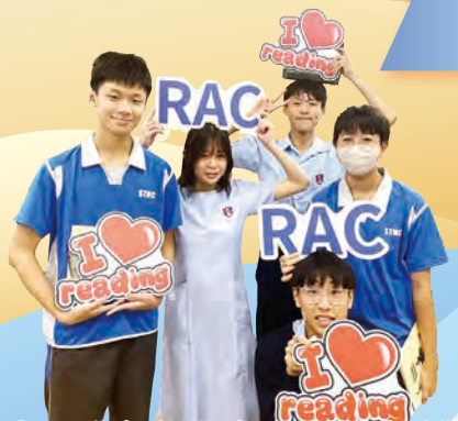
中三同學享受跨學科閱讀週的豐富活動