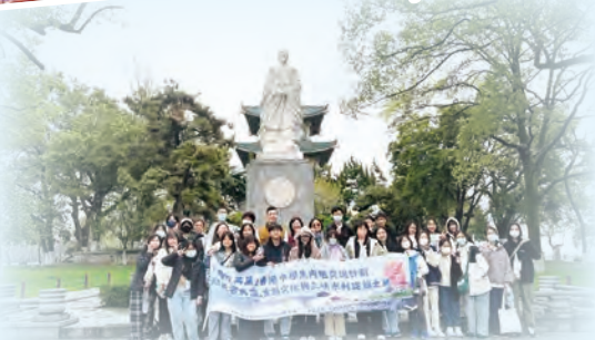
文學科與中史科帶領高中同學參加「同行萬里—湖北省武漢、宜昌文化與三峽水利建設之旅」